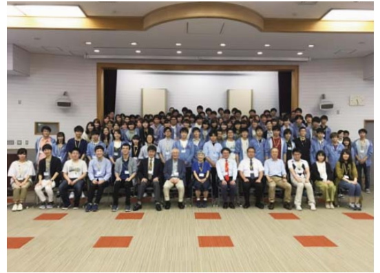
今年も皆さんやる気満々