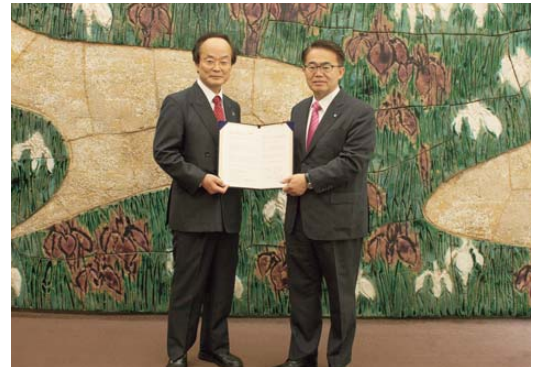
郡学長(左)と愛知県・大村知事(右)

2019年5月29日(水)、大学院医学研究科と、あいち小児保健医療総合センターとの間で、連携・協力の推進に関する基本協定を締結しました。今後、愛知県を始めとする地域およびわが国における学術および科学技術の発展ならびに有為な人材の育成に資するため、両者の研究能力および人材を生かし、連携・協力を促進していきます。