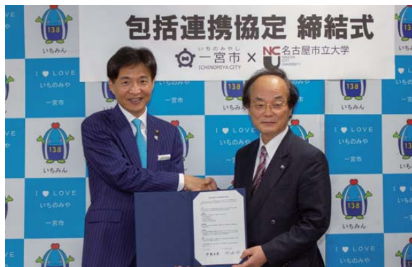
愛知県一宮市・中野市長(左)と都学長(右)

2019年6月28日(金)、一宮市と包括連携協定を締結しました。一宮市とは、2011年から子どもの健康と環境に関する調査「エコチル調査」、さらに今年度は、名岐道路建設による周辺地域への経済効果に関する共同研究について取り組むことを予定しており、一宮市と産業、経済、文化、教育、健康、福祉、医療等の分野で相互に協力し、名古屋大都市圏の発展と人材の育成に寄与していきます。