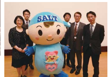
日本高血圧学会減塩啓発キャラクター「良塩くん」と 演者、スタッフ一同